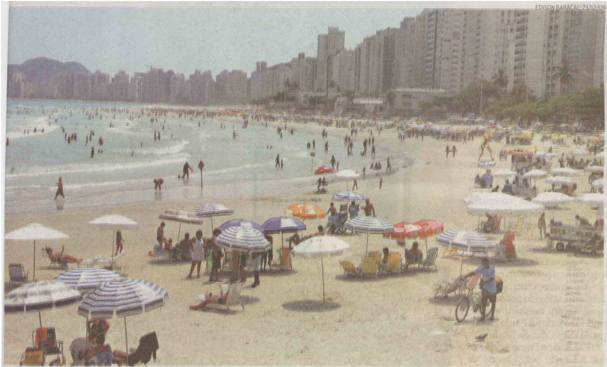
A beleza das praias do Município, entre as quais a de Pitangueiras, seria priorizada no programa do apresentador Otávio Mesquita